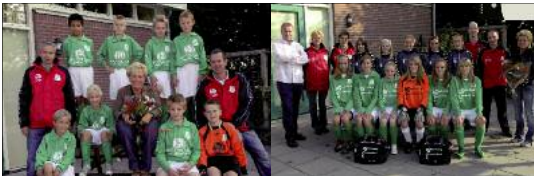
Het A-elftal van de meiden kan altijd nieuwe spelers gebruiken! Ben je tussen de 14 en 18 jaar en lijkt het je leuk om te voetballen, kijk dan eens op http://teugema.hyves.nl .