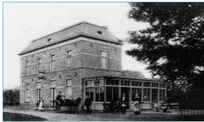
Begin 20e eeuw heette de Zwaan 'Cafe en Uitspanning Kloosterboer'.

De verbouw van de Zwaan ligt even stil, maar de eigenaar hoopt toch dat er in januari weer verder gebouwd kan worden. Dan zal eerst de monumentenvergunning (de Zwaan is een gemeentelijk monument) aangepast en goedgekeurd moeten worden. Daarna kan dan de bouwvergunning behandeld worden. Dat dit op zijn minst meerdere weken zal duren moge duidelijk zijn. Al met al zit Teuge nog steeds met een nu wel heel armoedig uitzien pand opgescheept.