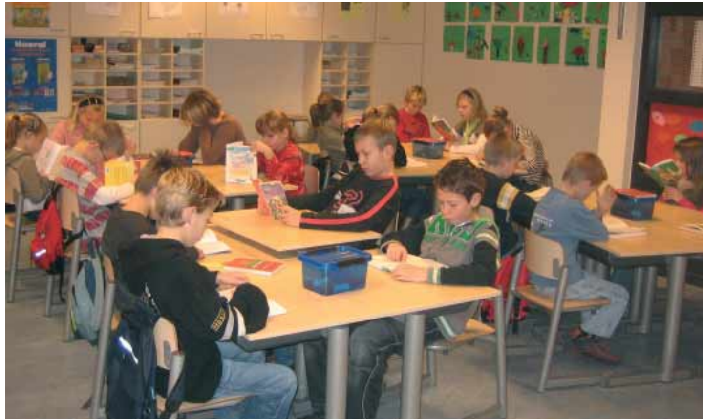
Geconcentreerd lezende kinderen en leerkrachten op de Zaaier