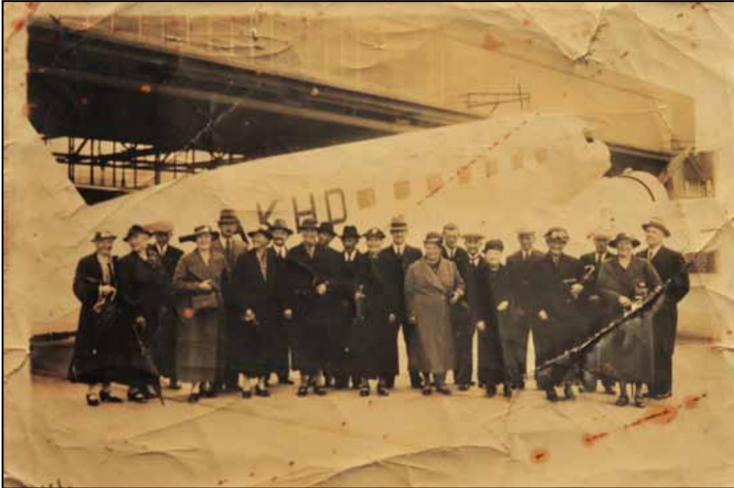
Jaarlijkse uitstapje Algemeen Belang Teuge in ±1935

Letterlijke tekst van de eerste bestuursvergadering van 5 januari 1911, uit het boek waarin jarenlang de jaarverslagen werden geschreven.