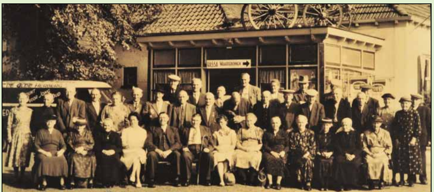
De bejaarden van Teuge poseren in 1965 voor 'de Olde Herberg'

Bijzonder amusant om te lezen, vooral zo lijkt mij, voor de autochtone Teugenaar, die veelal nog herinneringen hieraan heeft.