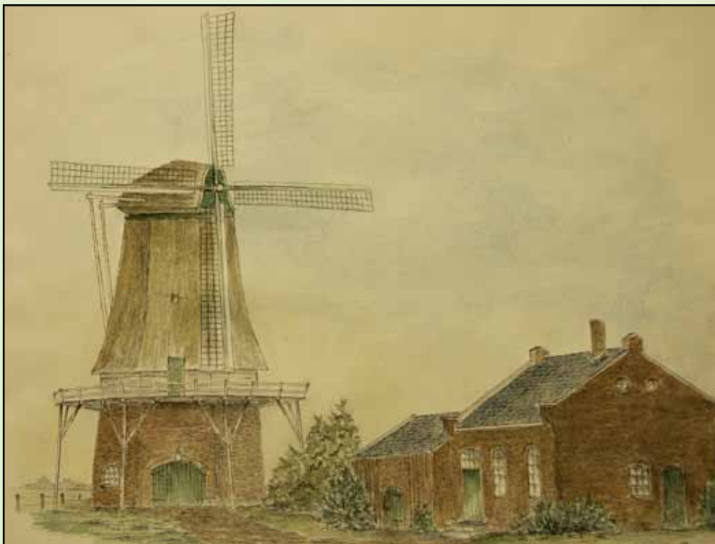
Theo Jansen tekende de graanmolen van Golstein.

In de vergadering in 1913 meldde dhr. Kolkman dat de Rijksontvanger te Twello het aantal aangiften te gering vond om in Teuge een kantoor van aangifte open te stellen. Het bestuur besloot hierop niet verder op dit punt in te gaan.