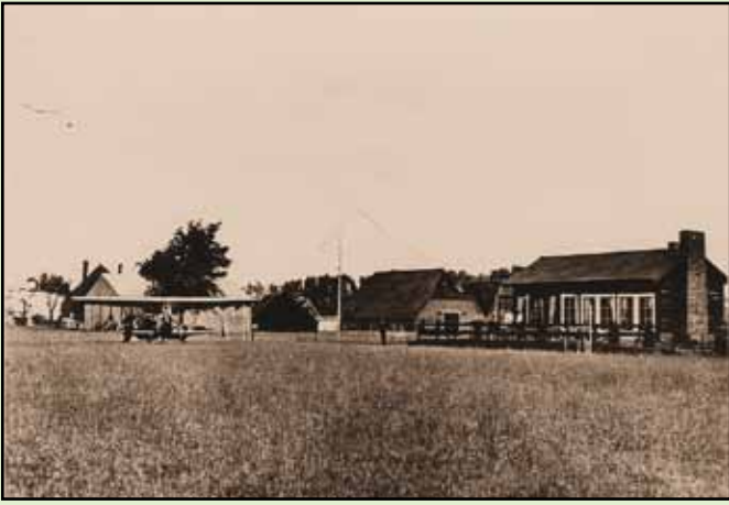
Het clubgebouw van de vliegclub in een grijs verleden.

vermijdbare vlieghinder ook daadwerkelijk zou worden bestreden. Er wordt tot op vandaag verschillend geoordeeld over de vraag of dat is gelukt.