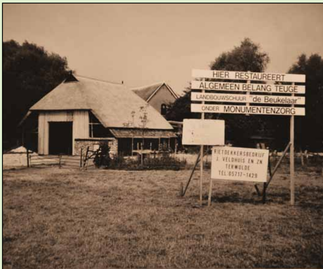
Samen met een groot aantal vrijwilligers realiseerde Algemeen Belang Teuge in 1995 de restauratie van de historische schapenschuur 'de Beukelaar'.

In 1967 werd door de voorzitter gemeld dat de plannen voor een sportterrein in een vergevorderd stadium waren en dat er waarschijnlijk nog in dat jaar over een dergelijk terrein kon worden beschikt.